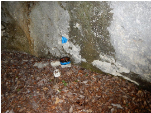
Contenitore per lasciare un commento sulle ripetizioni delle vie (nicchia prima delle corde fisse)