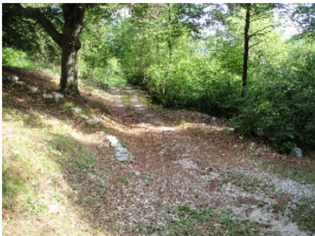
Stradina appena partiti dalla macchina