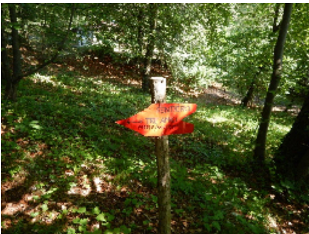
Freccia segnavia del sentiero 3 amici e parete