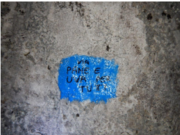
Esempio di scritta alla base della via PANE E UVA PER TUTTI