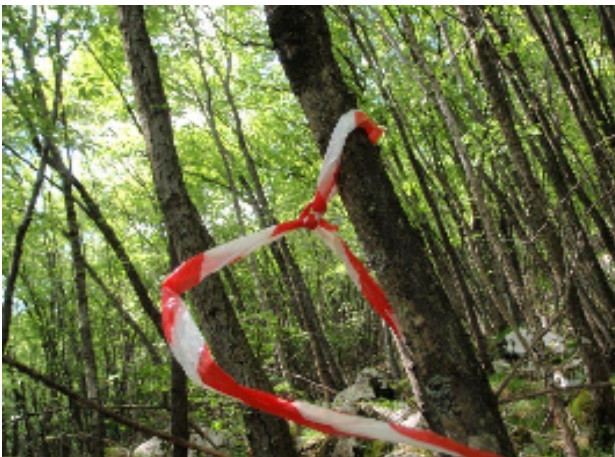
Nastri rossi e bianchi