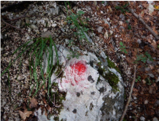
Bolli rossi del sentiero 3 amici