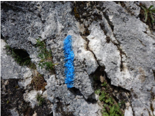
Bolli blu per arrivare alla parete nord-est.