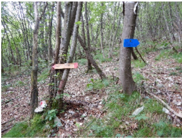
Bivio tra sentiero 3 amici e parete nord-est