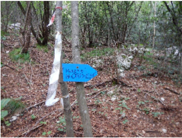
Cartello blu per la parete nord-est